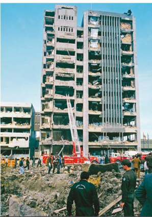
El 6 de diciembre de 1989 un carro bomba de más de 500 kilogramos de dinamita explotó enfrente del edificio del DAS en Bogotá, y dejó más de 50 muertos y 600 heridos.