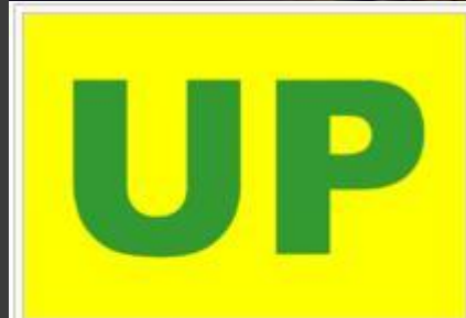
Bandera de la UP.